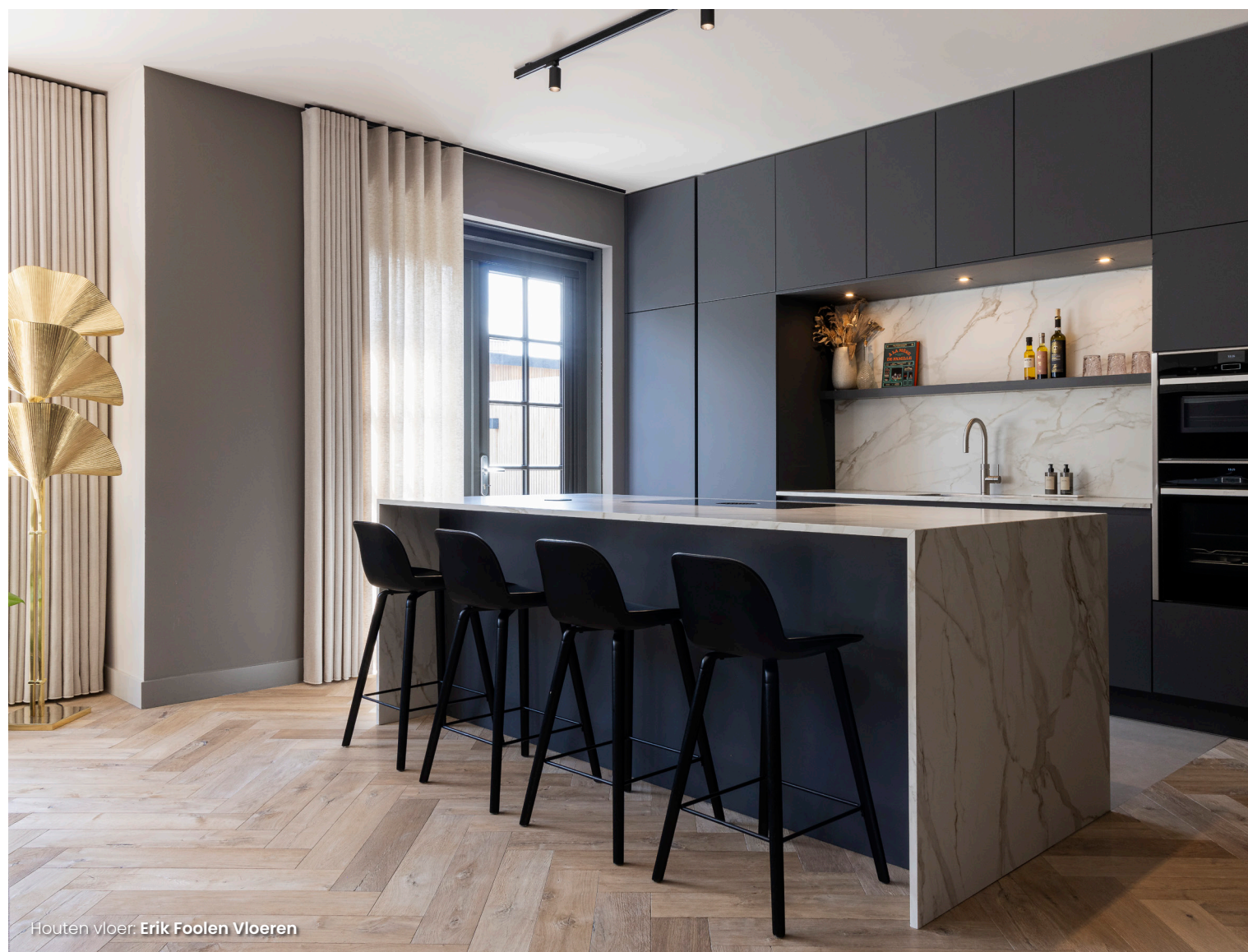
Houten vloer: Erik Foolen Vloeren

geen specifieke verwachtingen, maar ben heel blij met hoe het is geworden. Het is heel fijn om met een druk gezin in een rustig ingericht huis te wonen.”