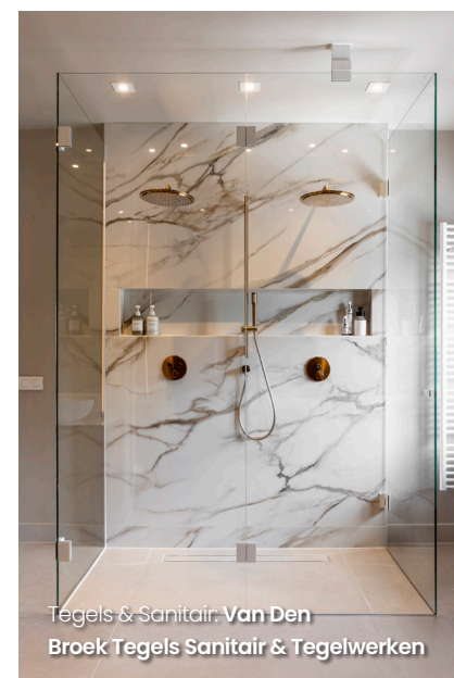
Tegels & Sanitair: Van Den Broek Tegels Sanitair & Tegelwerken