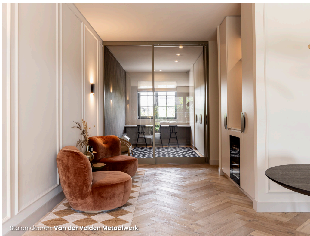
Stalen deuren: Van der Velden Metaalwerk