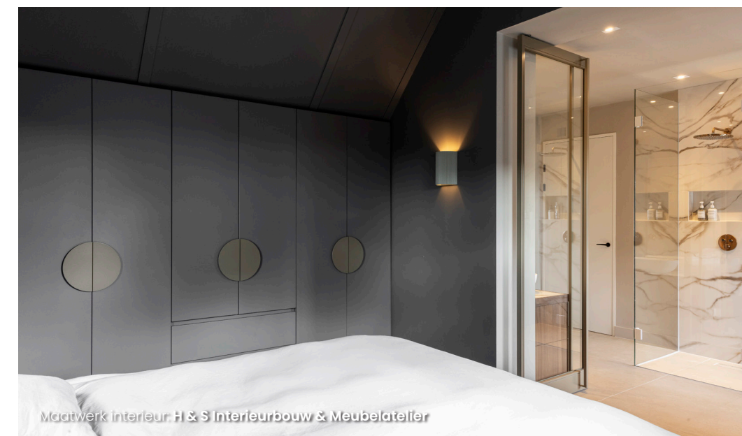
Maatwerk interieur: H & S Interieurbouw & Meubelatelier